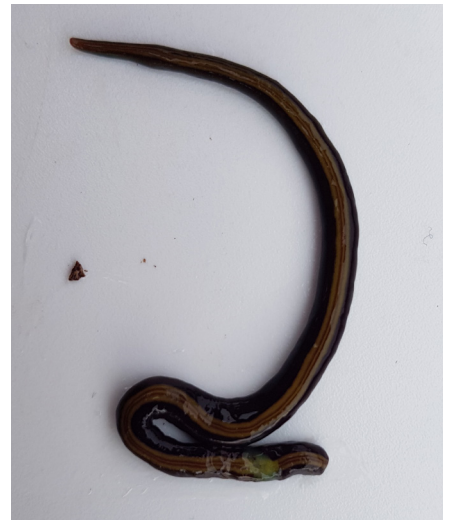
Plattwurm Caenoplana variegata gefunden bei einer Inspektion im Kanton Zürich. Diese Art wird deutlich länger als O.nungara : kann 15-20 cm lang werden.