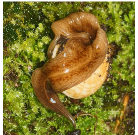
Plattwurm Obama nungara frisst eine Schnecke.